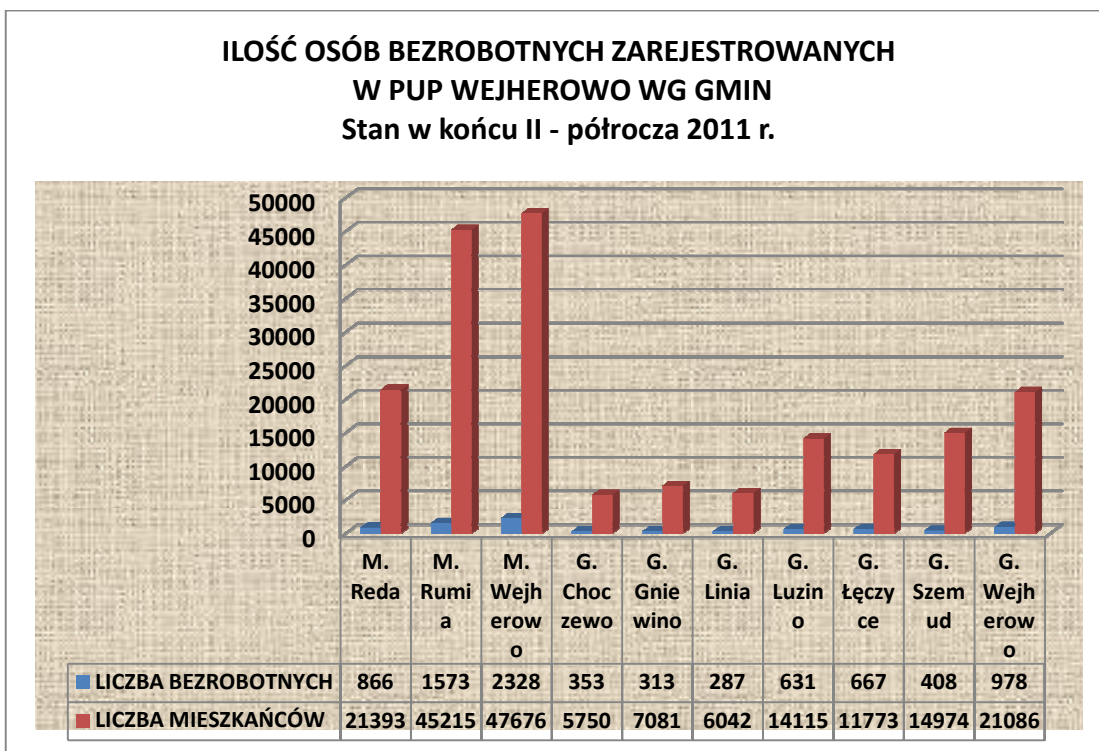
Wykres 2. Liczba osób zarejestrowanych w PUP w Wejherowie na dzień 31.12.2011 r. – podział według gmin (w tys) – analiza własna

Poniższy wykres przedstawia ilość osób zarejestrowanych w Powiatowym Urzędzie Pracy w Wejherowie na dzień 31.12.2011 roku z podziałem na gminy, w zestawieniu z ilością mieszkańców zamieszkujących daną gminę.