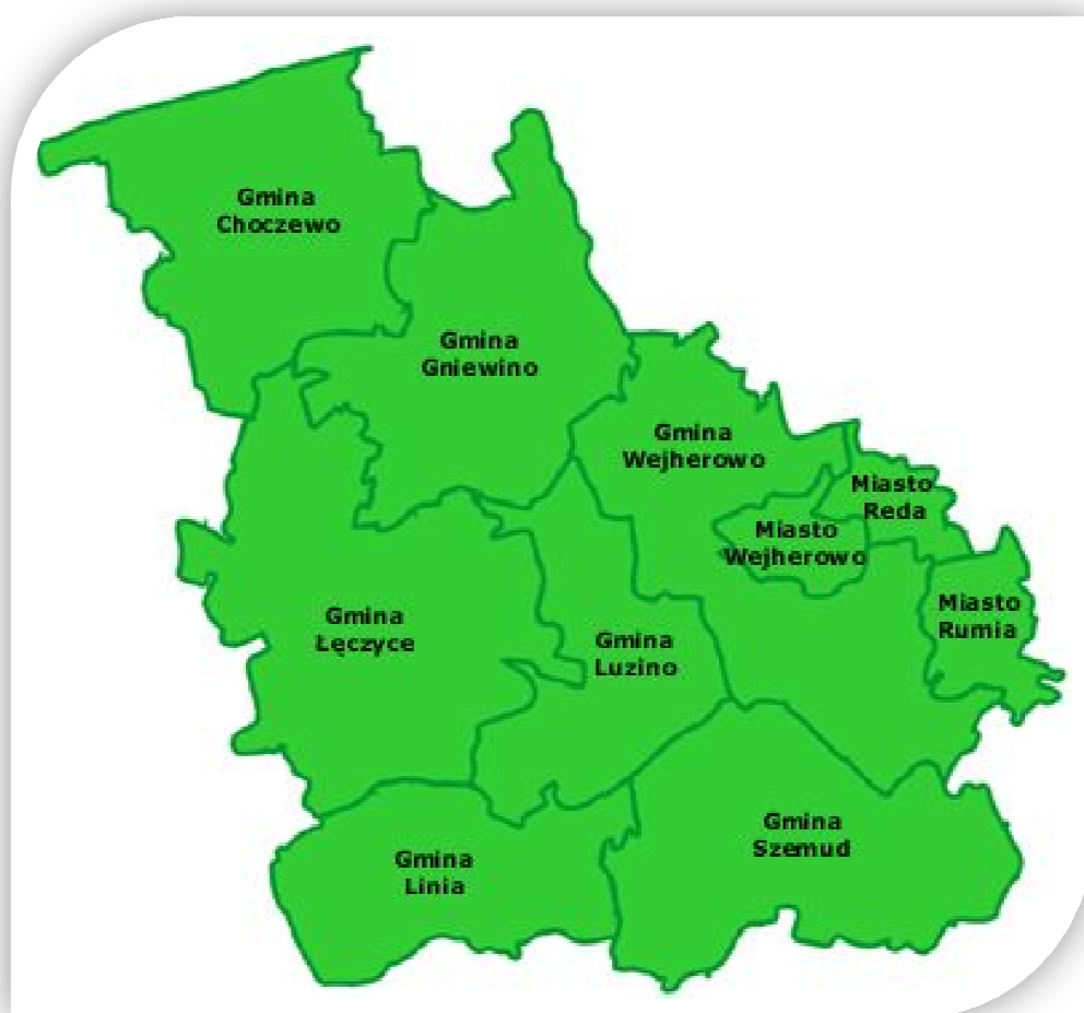
Rysunek 1. Zasięg terytorialny działania Powiatowego Urzędu Pracy w Wejherowie

Powiatowy Urząd Pracy w Wejherowie obejmuje swoim zasięgiem działania trzy miasta: Wejherowo, Rumie i Redę oraz siedem gmin: Wejherowo, Choczewo, Gniewino, Szemud, Linia, Luzino i Łęczyce.