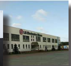
Pracy w Mławie wypracowują

kolejne rozwiązania w celu sprostania oczekiwaniom potencjalnych kandydatów do pracy.